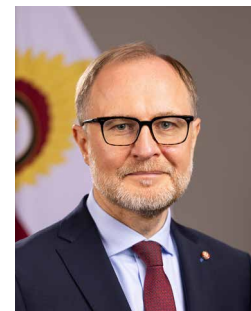
Aizsardzības ministrs Andris Sprūds

Nākamgad Latvijas aizsardzības budžets sastādīs 3,45 % no iekšzemes kopprodukta un tas būs lielākais aizsardzības budžets Latvijas vēsturē!